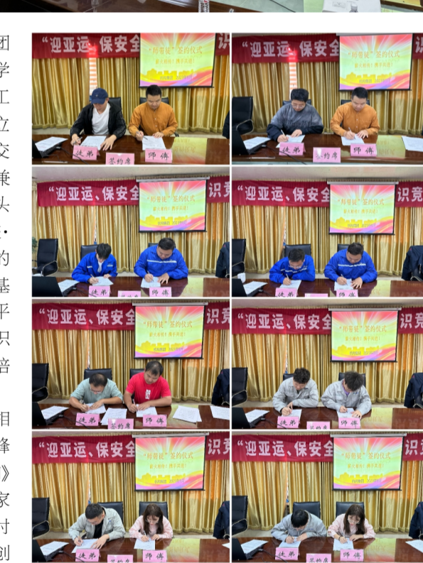
匠、争做工匠”的企业氛围和文化;以创建“创新工作室”和“五小”创新成果为抓手,团结引领职工立足本职、爱岗敬业,充分发挥示范引领和激励作用,用汗水铸就责任、用匠心坚守初心,立足岗位钻研技术,创新创业提高效益,助推企业高质量发展。(杭构集团 朱智韵)