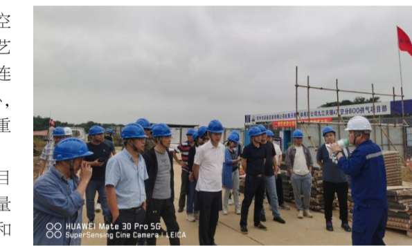
学习,都要积极“取经”,通过一天的观摩,要做到学有所得、学有所获。下阶段,要以此为契机,继续推广精品项目的经验和做法,以更有力量举措推动质量管控,以实际行动推动质量创新,不断树立优质工程,持续打响杭安品牌! (杭安公司 黄健洪、王捷)